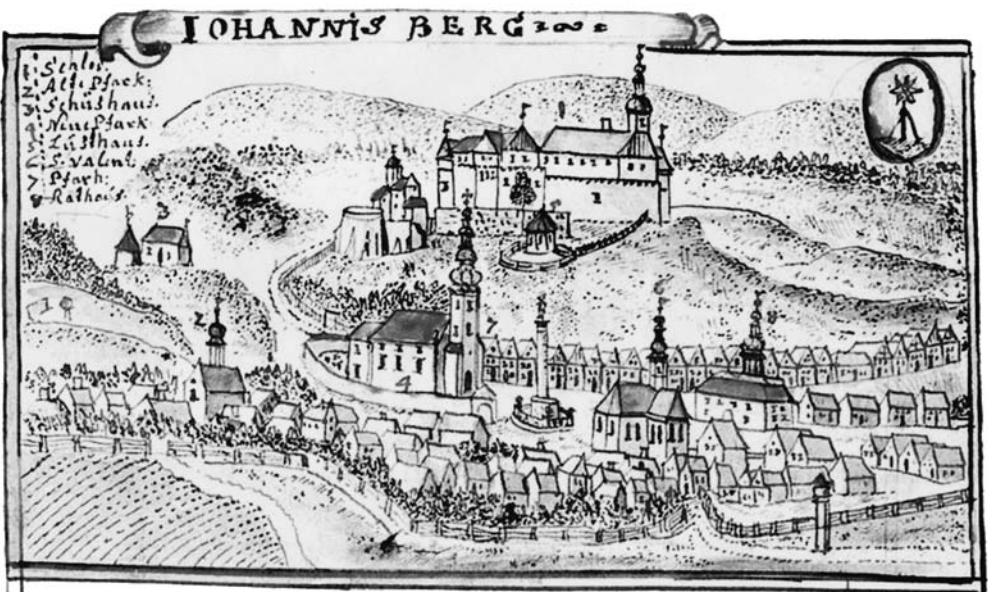
Nejstarší vyobrazení města Javorníku, autor litografie Werner