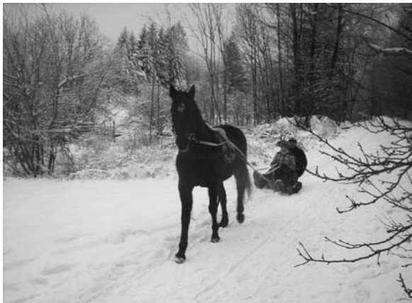
Háček a šťastní sáňkaři

Vyšly dvě reportáže o Ostrově Naděje, a to v týdeníku 5+2 a pak reportáž v Šumperském a Jesenickém deníku 12. 2. 2013 (6.2. www.denik.cz , kde najdete více fotek) Pevně věříme, že si do domova pro koně najde ještě více lidí cestu a pomůže koním trávit aktivnější čas.