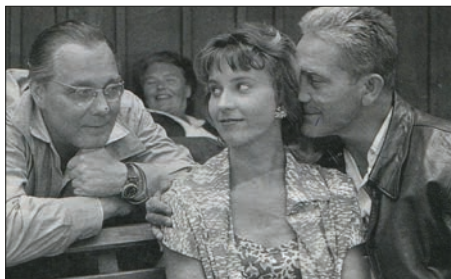
Foto z filmu Hlavní výhra

Se světem módy a předvádění se definitivně rozloučila v roce 1994. Profesionálně tak předváděla dlouhých 35 let. Po ukončení kariéry stihla vystudovat psychologii na Univerzitě třetího věku. V posledních letech se zabývá léčebnou kosmetikou ze Švýcarska, fascinuje ji esoterika a smysl pro spravedlnost. Je členkou Syndikátu novinářů ČR a od roku 2003 píše články do časopisu Krásná paní .