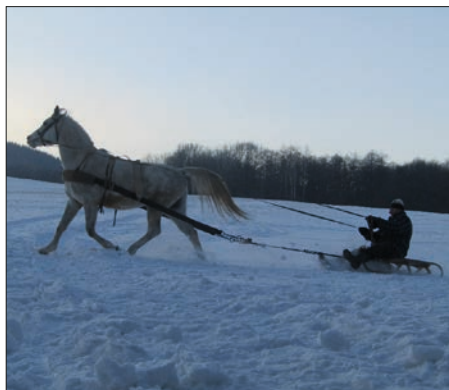
Sáňkování s Kavalonem